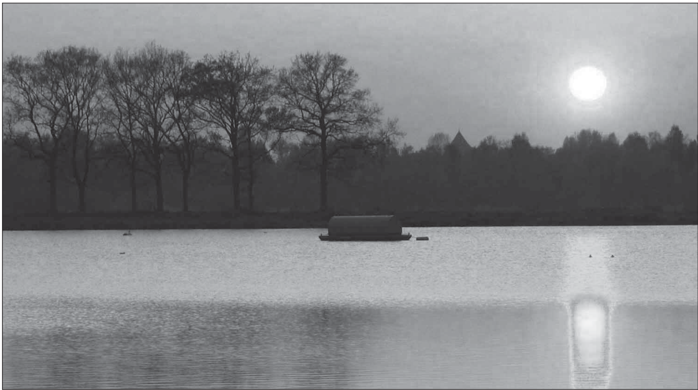
FOTO 2: DIEPE Plassen HEBBEN VOOR VELEN BIJZONDERE WAARDEN.

kelingen in regionale plannen (inspraak) en op het moment van de uitwerking van lokale initiatieven in een inrichtingsplan (afstemming).